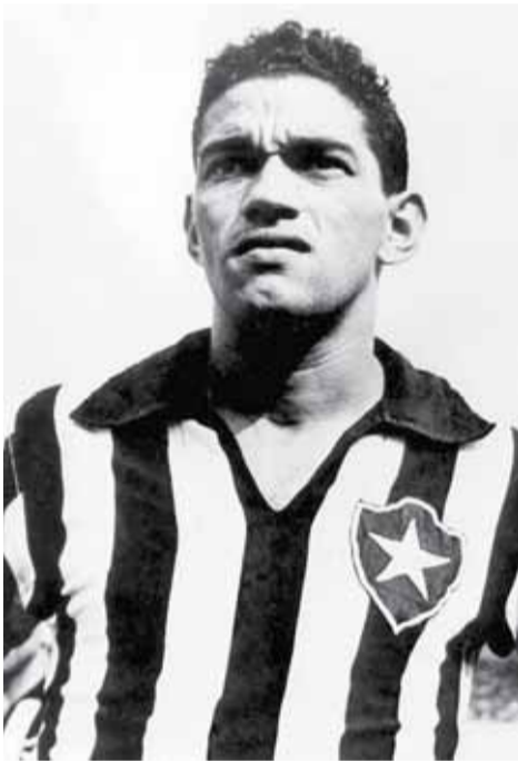
Гарринча (Чемпион мира по футболу 1958 и 1962 гг.)

Шутливое выражение «мастерство не пропьешь» на практике, как правило, оборачивается печальными последствиями. Сколько было сломано спортивных карьер и судеб из-за пагубного пристрастия к алкоголю. Хотя бывали и счастливые исключения... Предлагаем читателям несколько таких историй.