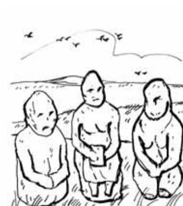
Рис. Сергея Лифатова