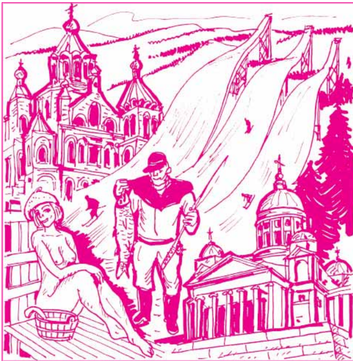
Рис. Сергея Лифатова

там говорить о крепких напитках!). Так что путешествовать по этой бывшей нашей территории безопасно и комфортно.