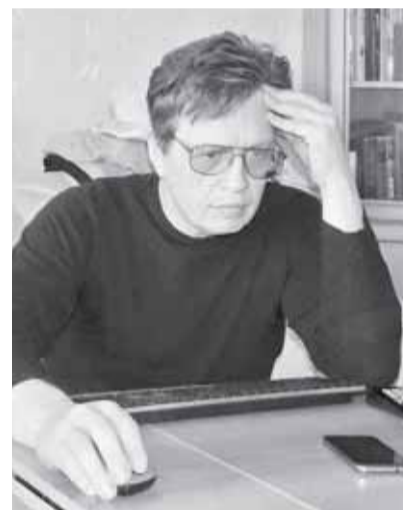
(Интервью с А.Л. Звонковым читайте на стр. 4)