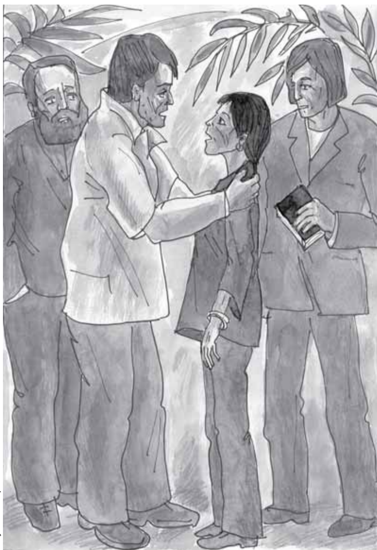
Рисунок С. Лифатова

«О, как я хотел вернуть Чарли! Ребенок рождается с открытым «родничком» на макушке. В него свободно струится твоя мерцающая, расплавленная любовь, которая со временем неспешно затягивает отверстие подобием кости. Но в первые недели жизни младенца тебя опьяняет необыкновенный аромат его головки.