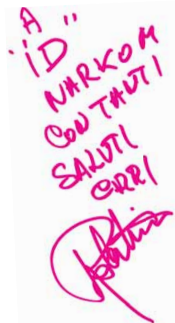
«ИД Нарком» с наилучшими пожеланиями!

Р.Л.: – Вы сделаете мне очень большое одолжение. Поцелуйте ее от меня!