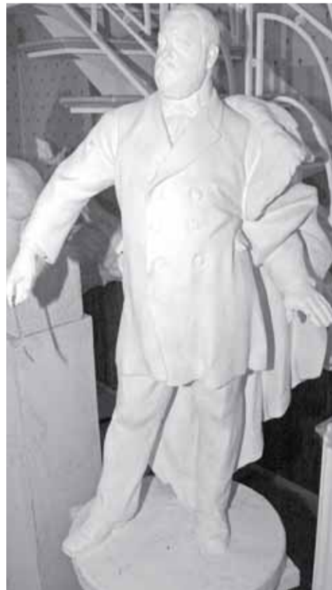
Проект памятника Николаю Алексееву

Располагая немалыми средствами и желанием направить кипучую энергию в благое русло – улучшить жизнь соотечественников, Николай Алексеев серьезно принимается за преобразование Москвы. В те времена столица была не самым комфортным для жизни городом – грязь и слякоть на улицах, особенно в осенне-зимний период, отсутствие фонарей, и самое главное – канализации. Уязвимая для пожаров, темная, мрачная и нечистая – такой Москва описана со слов очевидцев тех времен. Масштабные и решительные начина-