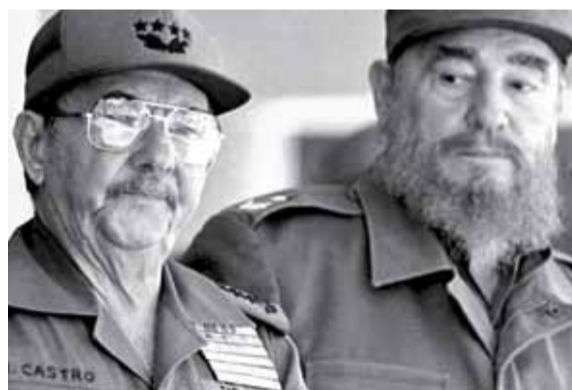
Фидель и Рауль Кастро

Надо попросить большую державу, опирающуюся на почти что тысячу военных баз и семь флотов, сопро-