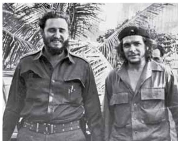
Фидель Кастро и Эрнесто Че Гевара

вождаемых ядерными авианосцами и тысячами боевых самолетов, которыми она тиранит мир, объяснить нам, как она собирается решить проблему наркотиков».