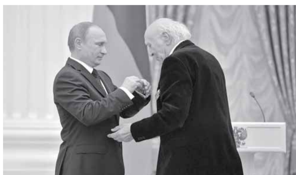
В. Путин награждает В. Балашова «Орденом Почета»

В.Б. — Я встречался с президентом трижды. Но мы никогда не говорили с ним о политике. В последний раз минут 15 разговаривали по телевизору, но потом из этой передачи много вырезали. Путин тогда подарил мне каминные часы, запечатанные, с его посланием. Но я расскажу вам о прошлогодней встрече, когда я получал из рук нашего президента орден. Я видел, как все выходили на трибуну, благодарили правительство, как раньше благодарили КПСС, говорили, что будет все хорошо и прекрасно... А я сижу думаю: зачем я буду говорить, что все хорошо и прекрасно? Выхожу я на трибуну и говорю: «Дорогие друзья, все хорошо, сегодня звучало, были произнесены хорошие добрые слова. Позвольте мне тоже сказать добрые слова. Владимир Владимирович, прекрасные добрые слова, которые слышала вся наша страна, каждый день, с утра до вечера, были такими: «Внимание: говорит Москва. Работают все